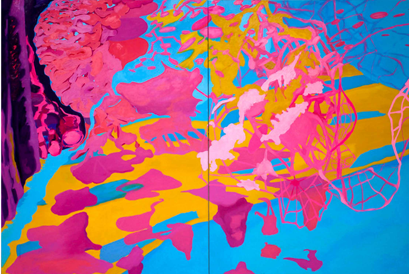
„No title found yet“, 2021, Öl auf Leinwand, 200 x 300 cm